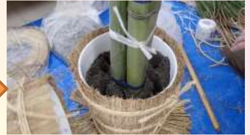
砂を入れ竹を立てます