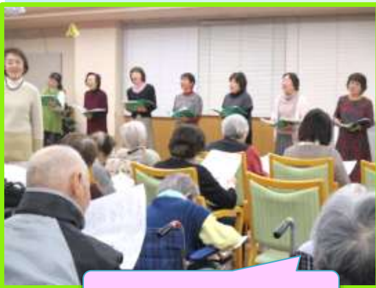
いい湯だな～(*_*)ハハハ♪