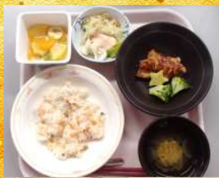
クリスマス ピラフ・バーベキューチキン