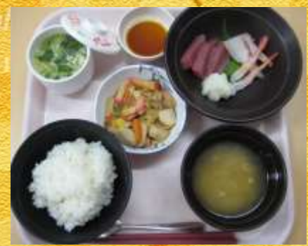
12月31日夕食 刺身・のっぺ・茶碗蒸し