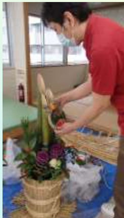
千両・葉牡丹を彩りよく飾り付けます