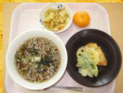
12月31日昼食 年越し蕎麦