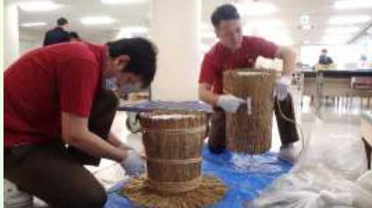
容器にわらをこもで巻き付けます