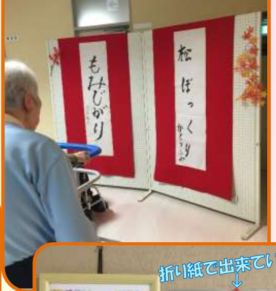
折り紙で作られています