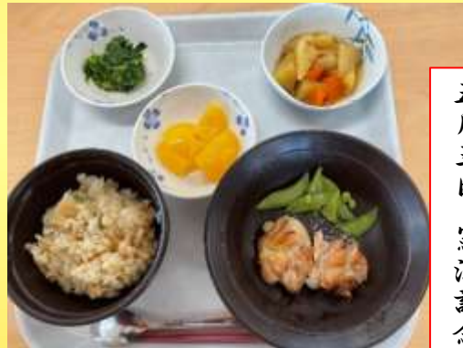
五月三日 憲法記念日