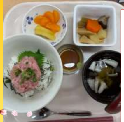
四月二十九日 昭和の日