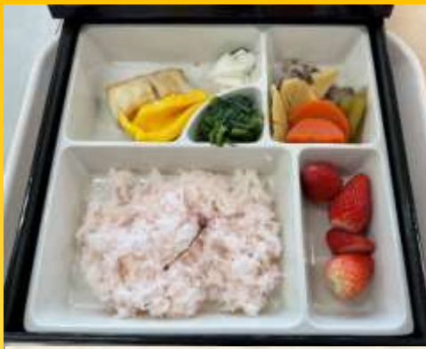
四月六日 お花見弁当