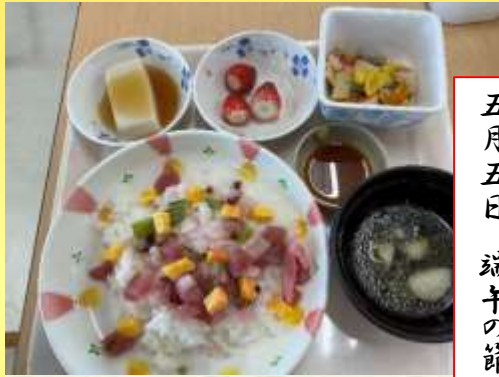
五月五日 端午の節句